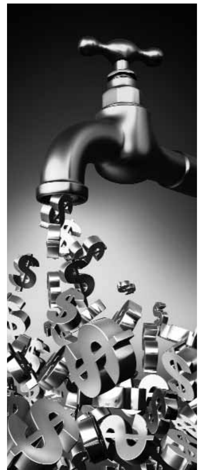
Een verregaande vereconomisering van onze maatschappij, gepaard gaande met onder meer technische hoogtesprongen, laten ook in de kerk hun invloed gelden.

catechese en je hoort het rondzingen in de gesprekken. Het is ook een splijtend kantelingsproces. Kunnen jongeren nog samen met ouderen één gemeente zijn en zo ja, kunnen zij dan ook in één en dezelfde kerkdienst bijeen zijn voor het aangezicht van God? Of is het maar beter ieder zijn eigen kerketuintje te geven? De één zit degelijk stil en de ander dertelt jolig rond? Natuurlijk chargeer ik en veralgemeniseer ik. Maar, mij dunkt, het is op z'n minst herkenbaar. Bovendien veroorzaakt dit alles in menige gemeente een stuk onrust en onderlinge verwijdering. Hier en daar doet zich het verschijnsel voor dat gemeenten zich omvormen van een (verstarde?)